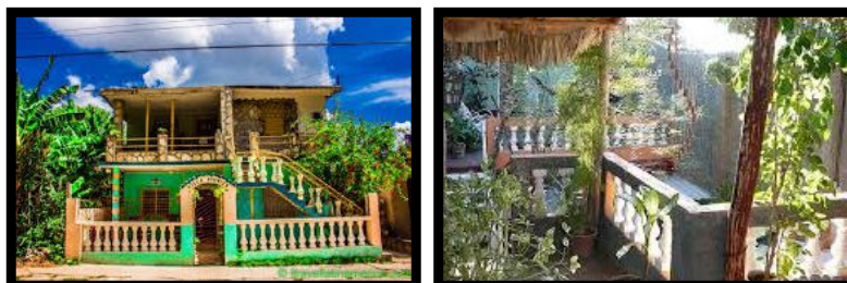
Casa particular (chez l'habitant)

Il existe également la formule « fast food » à Cuba, et elle est très bon marché